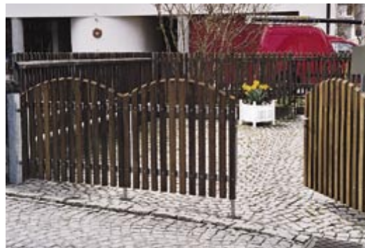
Staketentor dreiflügelig, mit Stahlrahmen

Es würde zu weit führen, an dieser Stelle auf alle technischen Möglichkeiten einzugehen, die der Staketenzaun bietet. Rufen Sie uns einfach an, oder senden Sie uns einen Fax bzw. ein E-Mail, damit wir Ihnen ein individuelles, für Sie unverbindliches Angebot unterbreiten können.