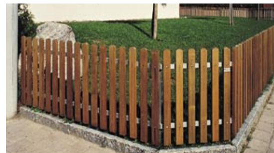
Staketenzaun lasiert, mit Metalltraversen