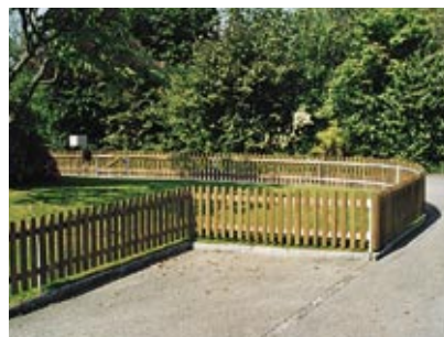
Staketenzaun grünlich imprägniert, mit Holztraversen