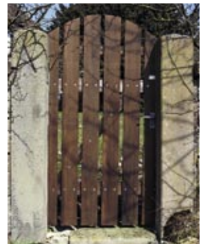
Staketentüre mit Holzrahmen