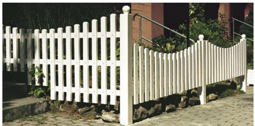
Staketenzaun geschweift, weiss gestrichen