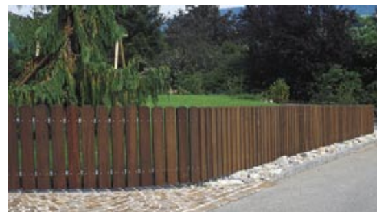
Breitstaketen braun imprägniert, mit Metalltraversen

Der vornehme Charakter des Staketenzauns unterstreicht in angenehmer, freundlicher Art die gepflegte Erscheinung einer Liegenschaft. Seine einwandfreie Qualität garantiert Ihnen eine lange Lebensdauer. Die Ausführung erfolgt vorwiegend mit Metallpfosten und -traversen, kombiniert mit Holzstaketen. Pfosten setzen wir in vorbereitete Aussparungen. Wir übernehmen bei Bedarf auch die notwendigen Fundamentarbeiten.