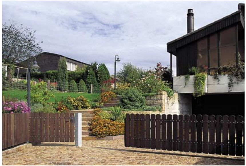
Freitragendes Konsolschiebetor und Servicetüre

Erfolgt die Ausführung mit Metalltraversen, so beträgt die Pfostendistanz zwei Meter. Staketen aus Tannen- oder Lärchenholz sind 26 oder 20 mm stark, allseitig gehobelt und in verschiedenen Breiten lieferbar. Ihre Befestigung geschieht mit rostfreien Schlossschrauben. Die Staketenabstände können beliebig gewählt werden. Sämtliche Metallteile sind verzinkt. Das Holz wird im Vakuum-Druck-Verfahren imprägniert. Die preisgünstigere Variante des Staketenzauns ist diejenige mit Holztraversen und aufgenagelten Staketen. Statt der Ausführung mit Metallpfosten kann auch eine solche mit Lärchen- oder Eichenpfosten gewählt werden.